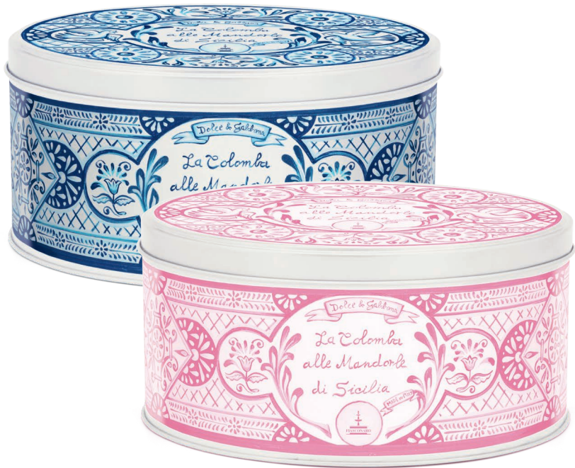
La Colomba alle Mandorle di Sicilia Colomba with Sicilian Almonds