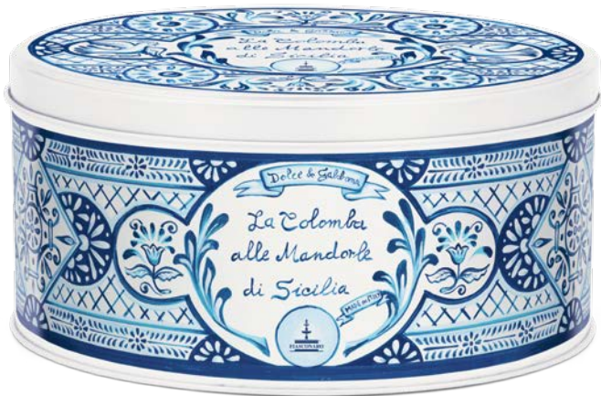
La Colomba alle Mandorle di Sicilia Colomba with Sicilian Almonds