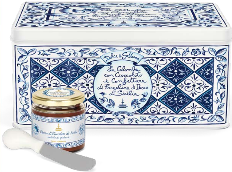
La Colomba con Cioccolato e Confettura di Fragoline di Bosco di Sicilia Colomba with Sicilian Chocolate and Wild Strawberry Jam